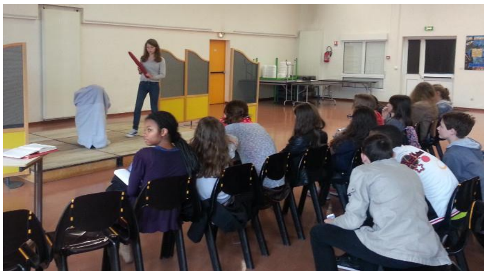
Répétition « scène du sac » collège Charles Rivière Olivet-45 (depuis 2013)

L'atelier pédagogique consiste à mettre en scène les élèves des classes de 5 ème pendant l'heure de français sur des scènes de l'œuvre originale ( ou de l'adaptation ).