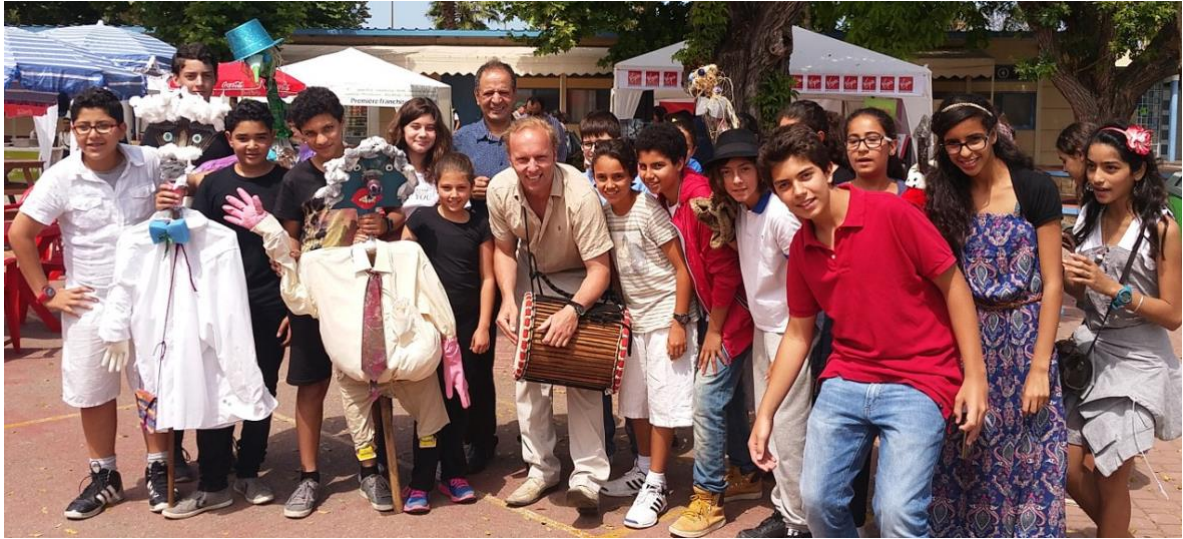
Classe de 5eme Collège St Exupéry - Rabat (Mai15)