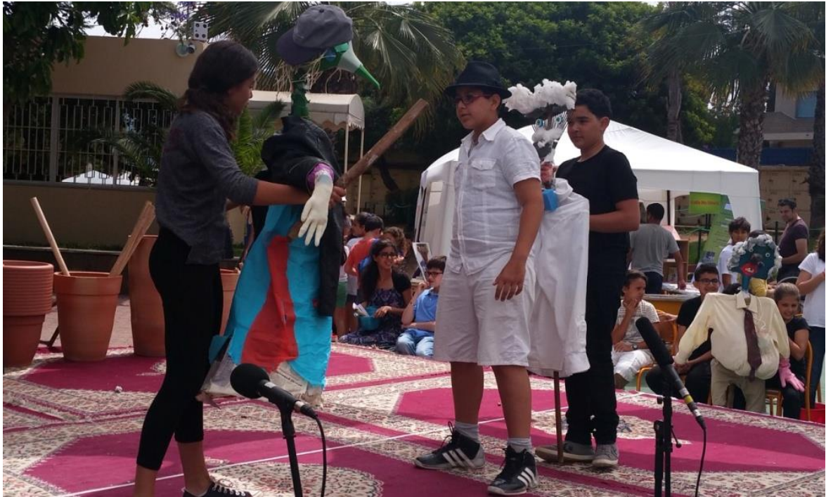
Élèves acteurs/manipulateurs d'objets insolites, fruit de leur imaginaire - Rabat (Mai15)

En mai 2015, des collégiens marocains ( le collège Saint Exupéry de RABAT ) ont travaillé des scènes de l'adaptation de François Manuelian Scapin au jardin . Ainsi les élèves acteurs étaient aussi manipulateurs de marionnettes conçues en coordination avec le professeur d'art plastique !